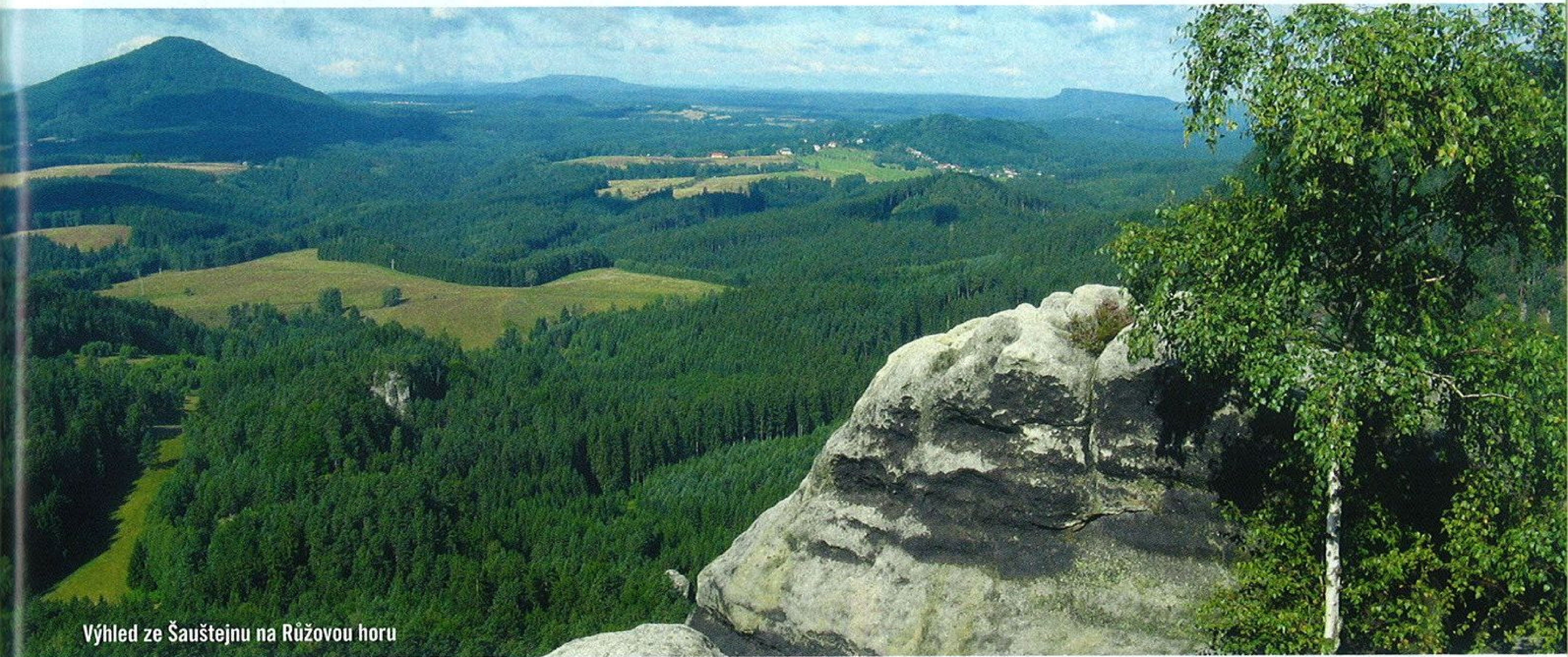
Výhled ze Šauštejnu na Růžovou horu

Šaunštejnem. Po třicetileté válce se úlohy obrátily, trosky se staly útočištěm lapků, a tak ho dnešní dobyvatelé, deroucí se úzkou skalní puklinou po žebříku za vyhlídkou do kraje, znají spíš jako Loupežnický hrádek.