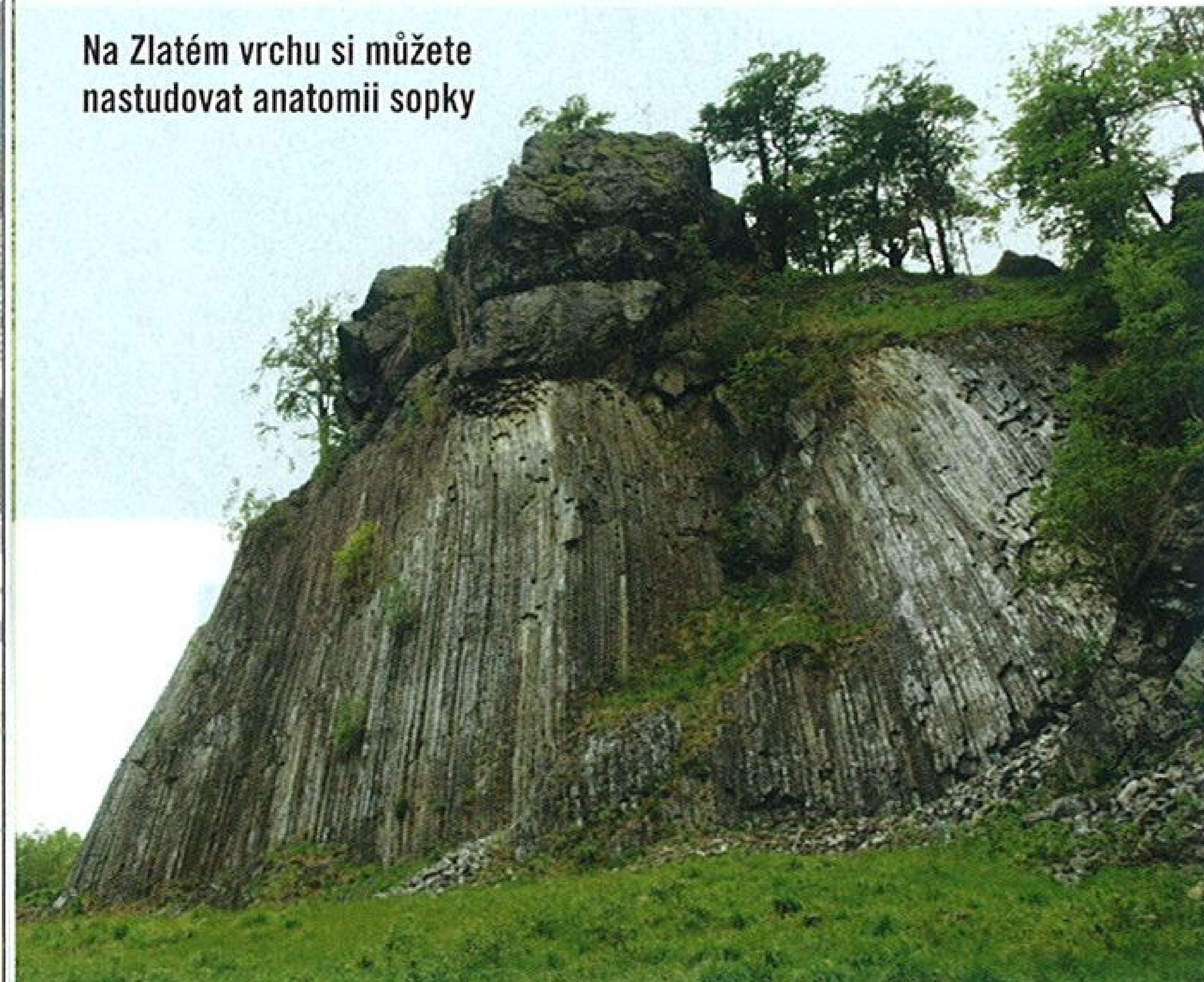
Na Zlatém vrchu si můžete nastudovat anatomii sopky

alespoň jedním směrem, do údolí Kamenice a na protější hřeben. Na horním konci Lísky jsme pokračovali původním směrem, k nedalekému Zlatému vrchu, někdejší sopce, jež v bývalém čedičovém lomu odkryla své ledví. Kamenné varhany, demonstrující sloupkovitou odlučnost čediče, svou velikostí několikanásobně překonávají mnohem známější nástroj v nedalekém Kamenickém Šenově, Panskou skálu, jež se turistům nevybíravě podbízí kýčovitým odrazem v kalném rybníčku a snadnou přístupností z placeného parkoviště.