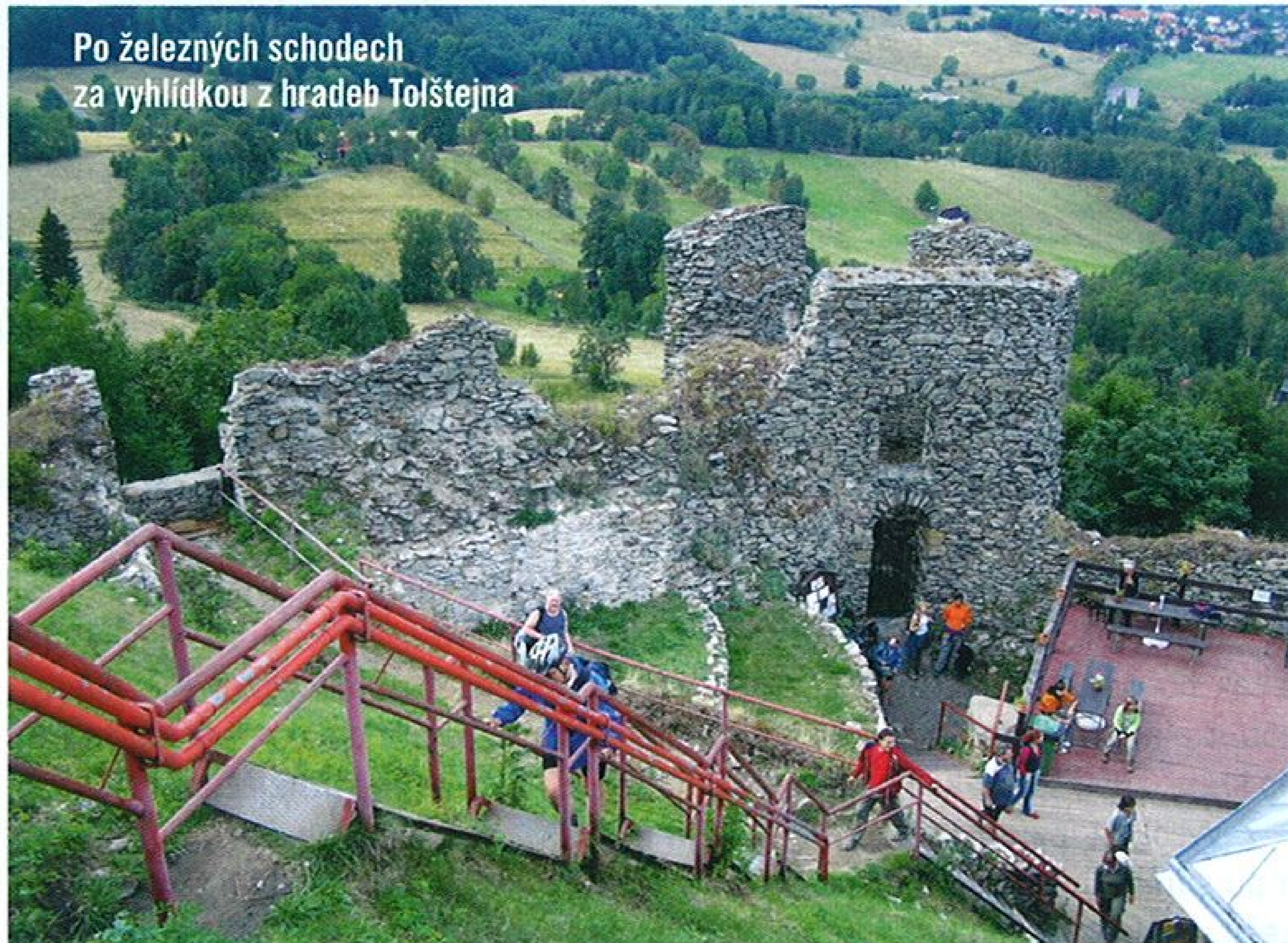
Po železných schodech za vyhlídkou z hradu Tolštejna

V troskách hradu najde zchvácený poutník příjemnou osvěžovnu, na hradbách vlaje prapor Tolštejnského království, které tu v cimrmanovském duchu usiluje o samostatnost, celé si ho snadno prohlédnete z vyhlídkové plošiny na hradbách, přístupné dlouhým železným schodištěm. Pro nás tím skončilo pracné šplhání do kopců, cílové Rybníště bylo přímo pod námi, ale rovnou k nádraží jsme se ještě zdaleka nechystali.