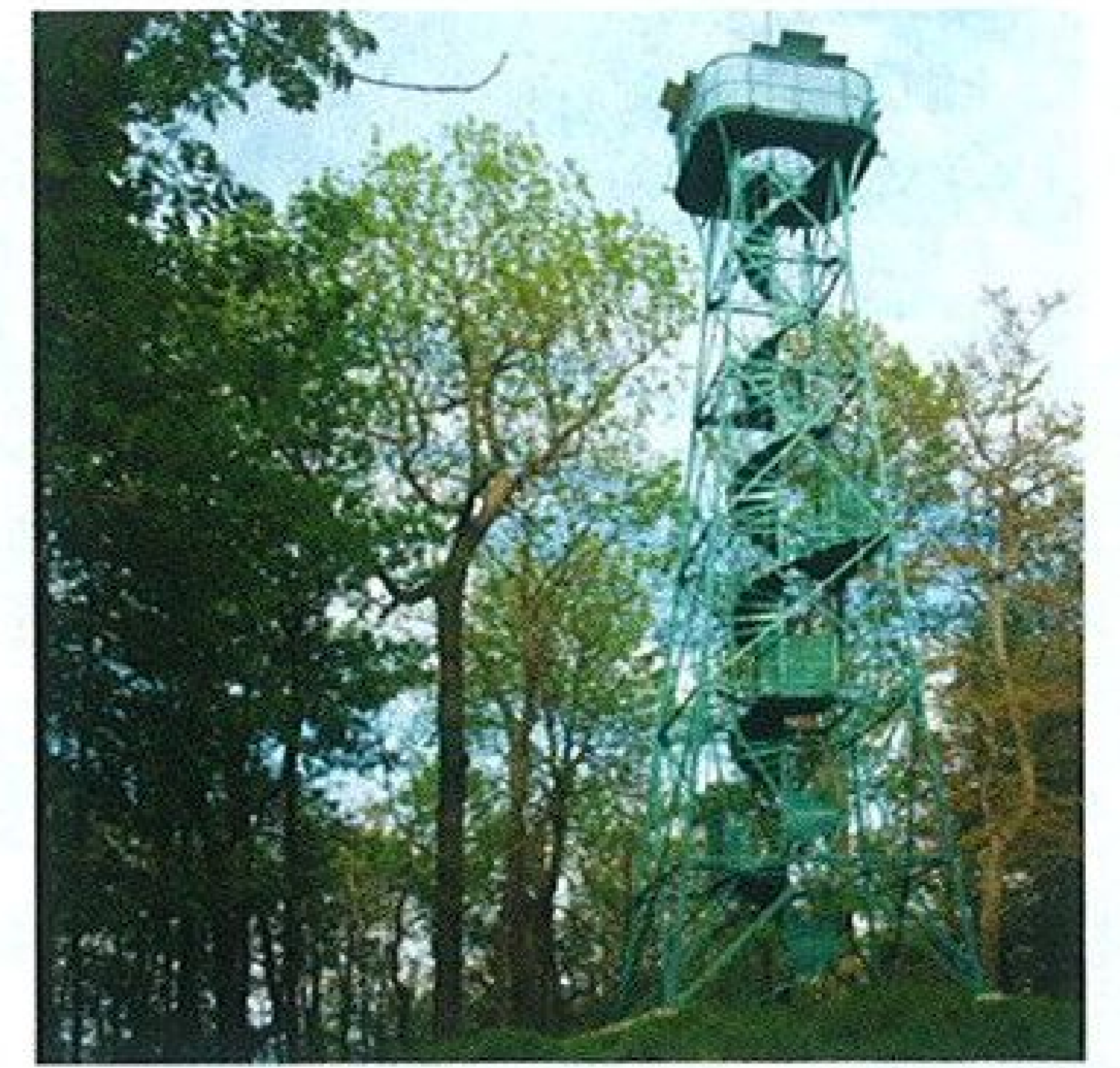
Novotou zářící druhá nejstarší železná rozhledna v Čechách